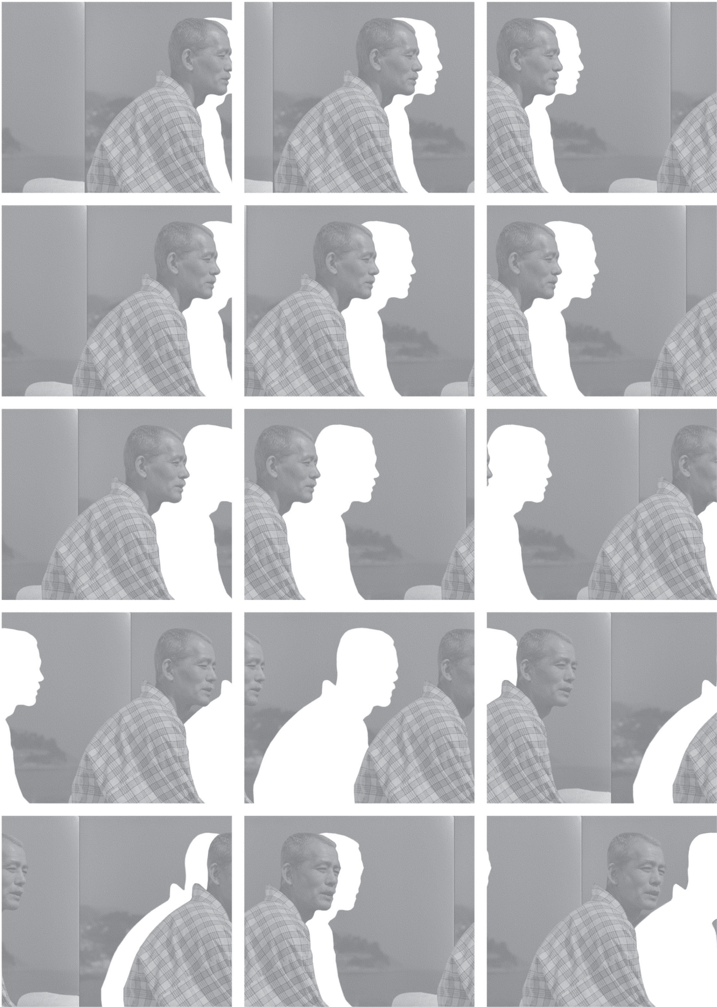
Ozu en 2.5D - panable